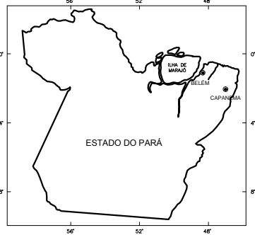
PLANTA DE SITUAÇÃO Escala