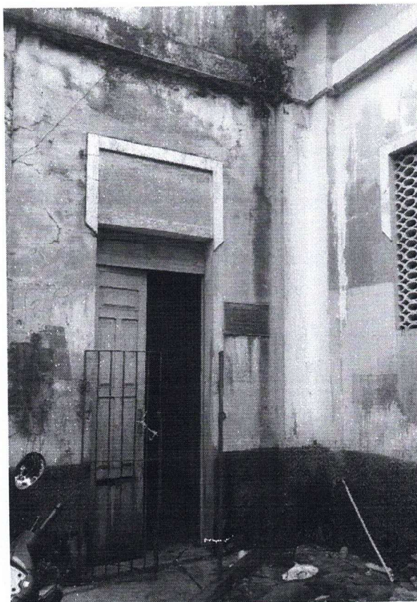
Foto setor administrativo