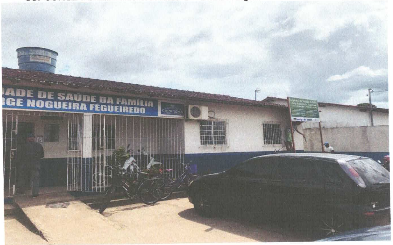
USF JORGE NOGUEIRA FIGUEIREDO – Caixa D'Água