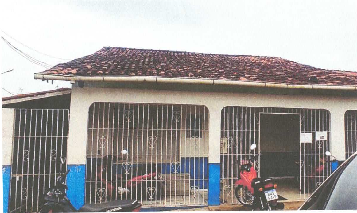
USF JOSEFHA A. MURIETA - São Cristovão – Rachadura recepção